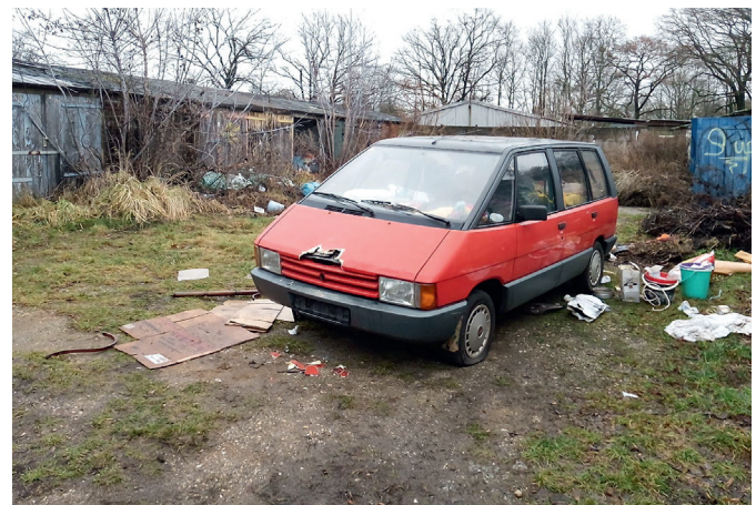
Dieser Renault wurde in der Möncherei sichergestellt. Wer kann Hinweise zum Fahrzeug oder zum Halter geben?